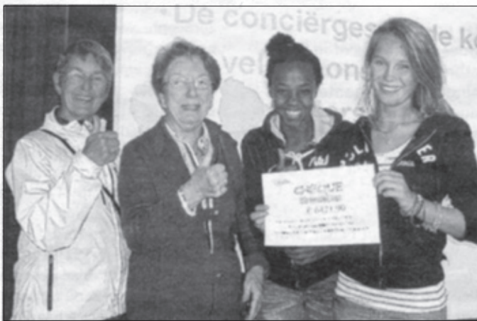
De actiedag van de leerlingen was een groot succes.

De leerlingen hadden veel verschillende manieren bedacht om het geld te verdienen: van culinaire hoogstandjes en entertainment voor bejaarden tot het wegbrengen van boodschappenkarretjes en statiegeldflessen. Maar ook van het verkopen van zelfgemaakte sieraden en sleutelhangers tot tuinieren en auto's wassen. De dag had niet zo succesvol kunnen verlopen zonder de vrijgevigheid en de leuke reacties van de voorbijgangers in de winkelstraten vanonder meer Soest.