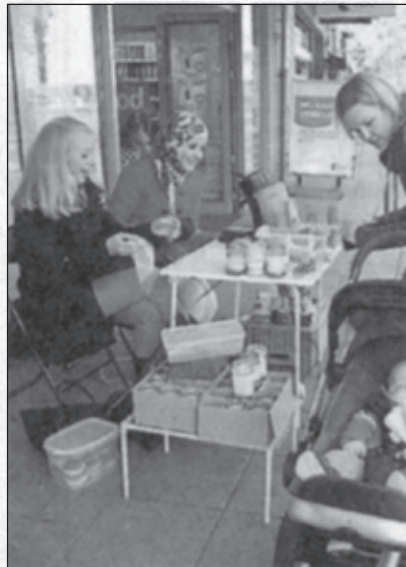
Actie van het Griffland.

een paar honderd mensen die afgelopen jaar grote en kleine bedragen hebben gegeven. „We hebben veel vaste donateurs en er zijn ook mensen die gewoon zomaar eenmalig iets overmaken”, legt ze uit.