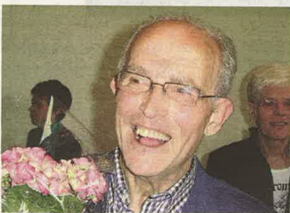
◀ Nee zeggen was ondenkbaar.