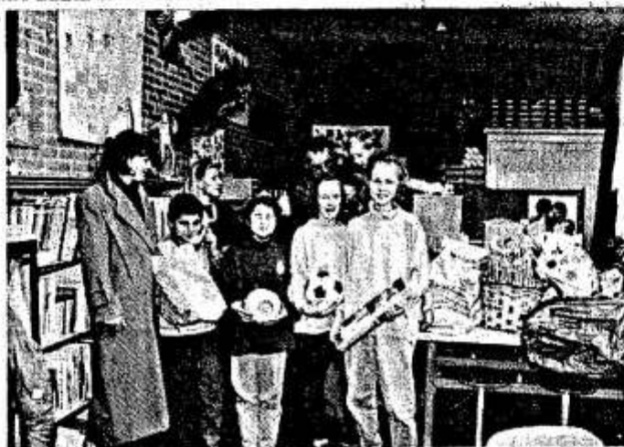
De inzameling is een groot succes.

De Derde Wereldgroep Soest heeft de afgelopen periode geld ingezameld door de aanschaf van schoolkleding en schoolboeken voor dit cursusjaar en voor verbetering van de veestapel van dit project. Ingezameld en reeds verzonden in een container werden kleding, gereedschap, naalgerei en weefmateriaal. Wat er nog niet was ingezameld en waar zeer grote behoefte aan bestaat, is speelgoed. De meeste kinderen hebben ten gevolge van ondervoeding en slechte levensomstandigheden een aanzienlijke motorische achterstand. Daarom is er een sterke behoefte aan eenvoudig baby- en kleuterspeelgoed, alsmede simpel speelgoed voor oudere kinderen. Afgelopen week werd door vele Soester kinderen van 15 deelnemende basisscholen een gigantische hoeveelheid aan speelgoed ingezameld. Blijkbaar leefde de gedachte dat andere kinderen