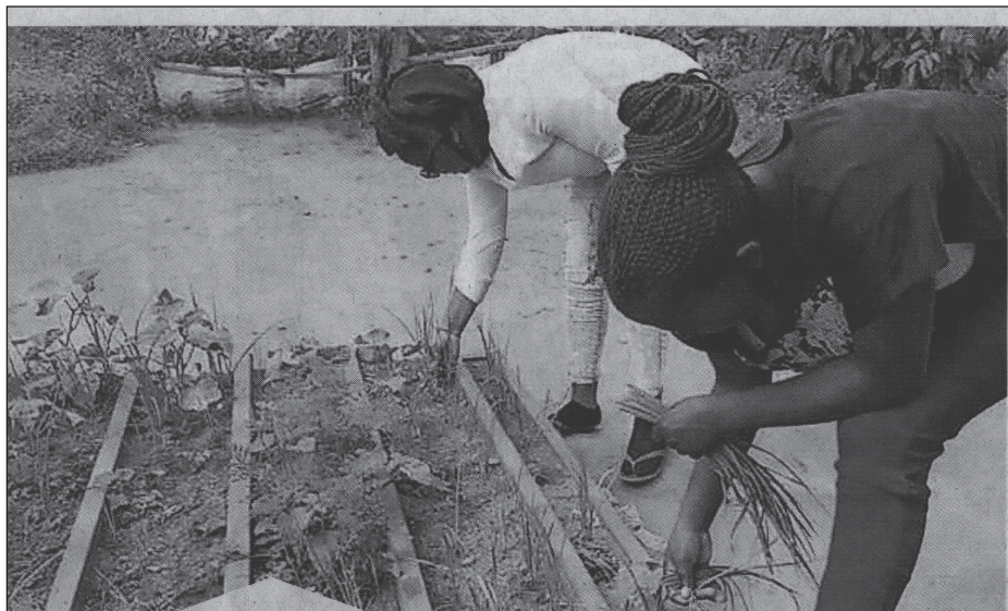
Derde Wereldgroep Soest