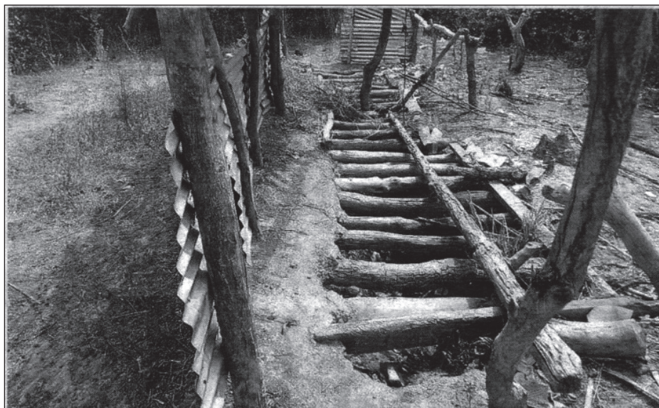
Derde Wereldgroep Soest